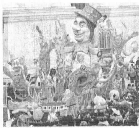
LA SFILATA Questa sera arrivano i carri mascherati e via Roma resterà chiusa al traffico da via Filzi a via Foscolo dalle 19 alle 24