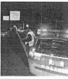
TAMPONAMENTO In autostrada A13, vicino al casello di Padova Sud