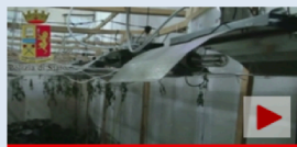
La serra di marijuana sequestrata dalla polizia a